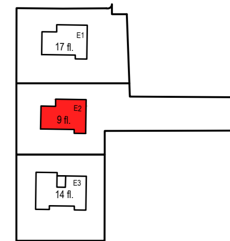
Экспликация квартир 8го этажа секции Е-2